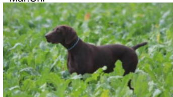
GABRIELLE DU GUE VASLIN 2011-10-27 (F) LOF 101266 (TR) - Mar.

Mère JOLIE DU GUE VASLIN 2014-03-01 (F) LOF 104289 (CHIB, CHIE, Trialer, BICP1, 10 CACIB, 20 CACS, CH IB, CH IE) - Mar.Uni