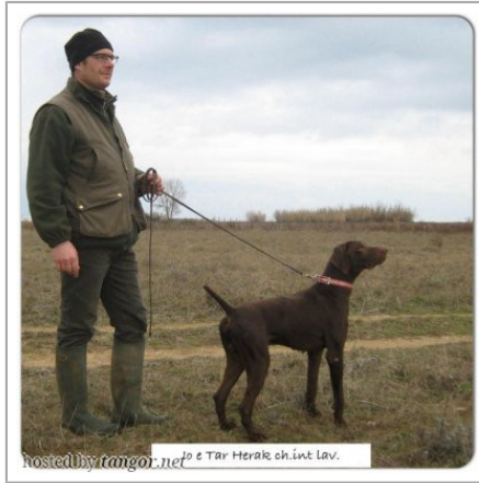
hosted by tangor.net ch.int Lav.

(M) HKS-21489-NEK-LOI-ROI-10/122209 Couleur : Mar.