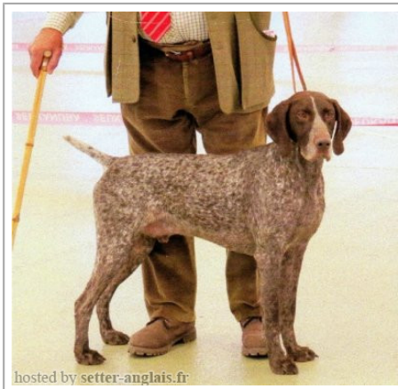
hosted by setter-anglais.fr