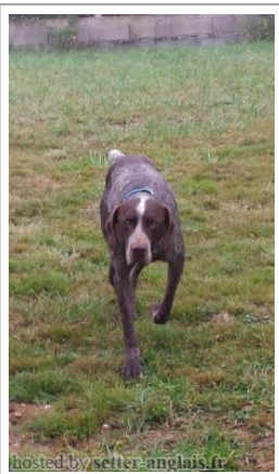
hosted by: setter-anplais.fr