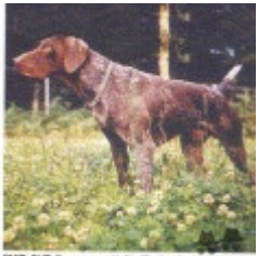
CHT CHT Franco -- Italie Tirolo du Mus de la

Note : les données ne sont pas garanties. Elles ont été entrées par les membres sans garantie d'exactitude.