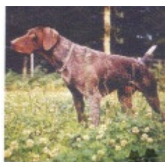
CHIT-CHT France — Italie Tintin du Mas de la

Note : les données ne sont pas garanties. Elles ont été entrées par les membres sans garantie d'exactitude.